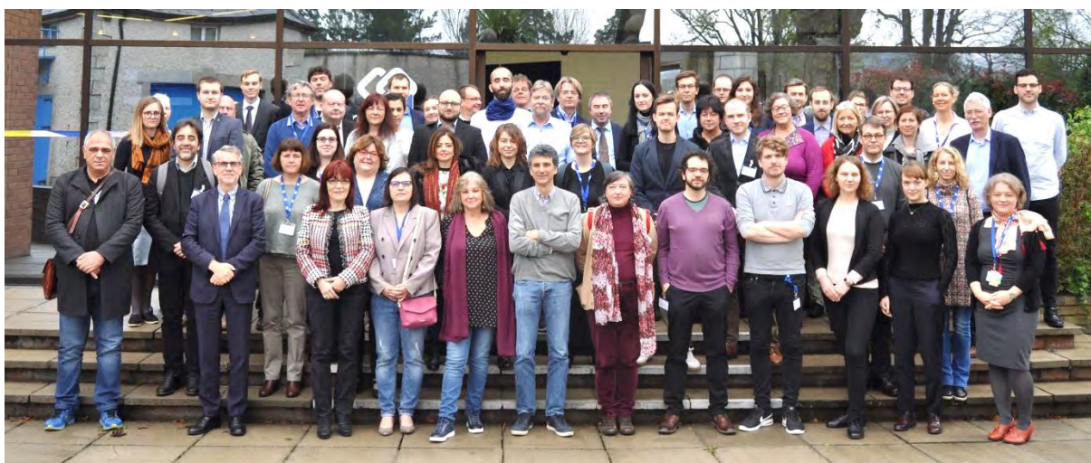
Network Annual Meeting 2019

Podrobnejšie informácie o organizácii Eurofound a projekte Network, vrátane príspevkov realizovaných korešpondentmi pri IVPR, sú k dispozícii na webstránke IVPR aj Eurofound, www.eurofound.europa.eu .