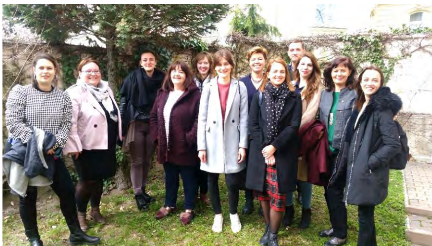
Študijná návšteva partnerských organizácií z chorvátsko-slovenského projektu HELPLINE, 25.3.2019

Prezentácia linky prebehla aj počas študijnej návštevy partnerských organizácií z chorvátsko-slovenského projektu HELPLINE. Názov projektu je akronym pre hlavný cieľ tejto iniciatívy - How Expertise Leads to Prevention, Learning, Identification, Networking and Ending Gender Based Violence.